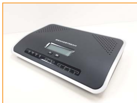
IP-PBX GrandStream UCM6204