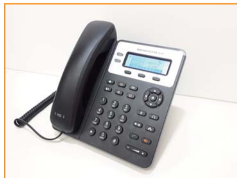
IP固定電話機 GrandStream GXP-1625